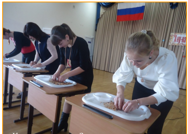
Конкурс для мам «Золушка»