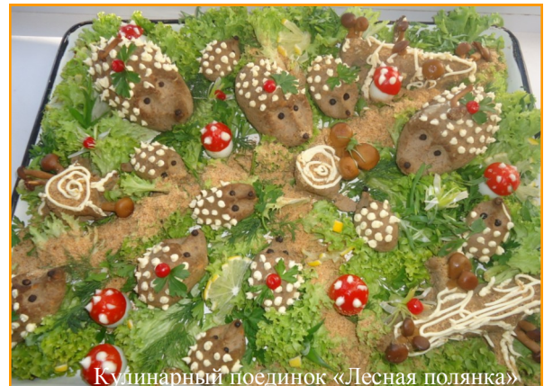
Кулинарный поединок «Лесная полянка»